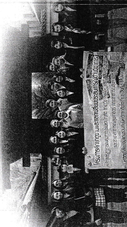
โครงการกึ่งชุมชนและแลกเปลี่ยนประสบการณ์เชิงปฏิบัติ หลักสูตรวิทยาศาสตรมหาบัณฑิต สาขาสุขศึกษาและการส่งเสริมสุขภาพ และสาขาสารสนเทศศาสตร์ คณะสาธารณสุขศาสตร์ มหาวิทยาลัยขอนแก่น ประจำปี 2556

- เปิดรับสมัครแบบโควตาเพื่อเข้าศึกษาในภาคต้น ประมาณเดือนธันวาคมถึงเดือนกุมภาพันธ์ - เปิดรับสมัครแบบทั่วไปตามกำหนดการของ บัณฑิตวิทยาลัย ดูรายละเอียดเพิ่มเติมได้ที่ : http://gs.kku.ac.th