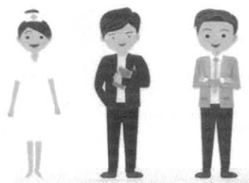
ภาควิชาการและวิชาชีพ