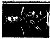
พลเอกอนุพงษ์ เผ่าจินดา รัฐมนตรีว่าการกระทรวงมหาดไทย