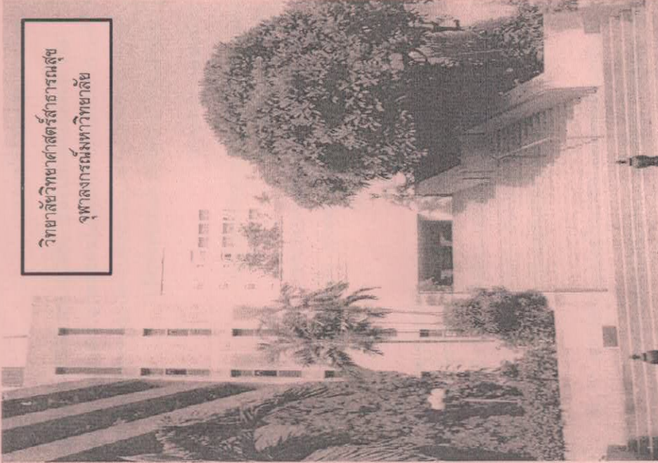
วิทยาลัยวิทยาศาสตร์สาธารณสุข จุฬาลงกรณ์มหาวิทยาลัย