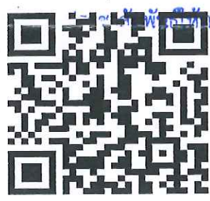
QR Code ลงทะเบียน

เรียน นายแพทย์สาธารณสุขจังหวัด - เพื่อโปรดทราบ