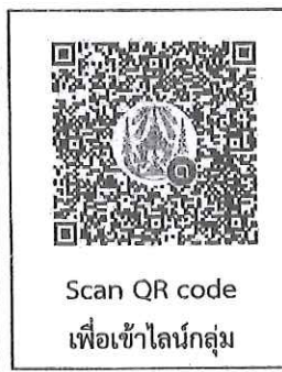
Scan QR code เพื่อเข้าไลน์กลุ่ม