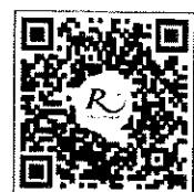
QR-Code สำหรับจองห้องพัก มหาวิทยาลัยศิลปากร

โทรศัพท์: ๐๒-๔๒๒-๙๒๒๒ โทรสาร : ๐๒-๔๓๓-๕๘๘๐ E-mail : rsvn@royalriverhotel.com