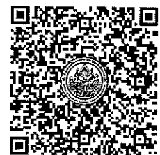
QR-Code เพื่อสมัครอบรม

ชื่อบัญชี : มหาวิทยาลัยศิลปากร เลขที่บัญชี : ๙๘๒-๓-๐๔๗๘๑-๒