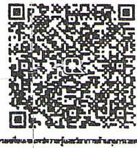
ใบตอบรับเข้าอบรม