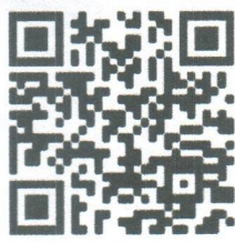
ส่งผลงานวิชาการ