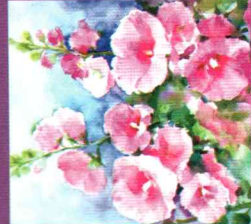
WS2 Watercolor Painting