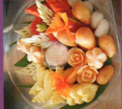
WS3 Fruit and Vegetable Carving for Beginners